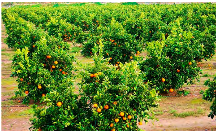
Figura 13: Agroecosistema

Como fuera puntualizado anteriormente, existen numerosas e importantes diferencias estructurales y funcionales entre los ecosistemas naturales y los agroecosistemas; lo estructural hace referencia a la organización del sistema, mientras que la función está referida a las conexiones y movimientos de materia, energía e información, entre los diferentes componentes estructurales del sistema y entre esos mismos componentes y el ambiente (Marten, 1988). En el ecosistema agropecuario, la diversidad de especies es baja y los individuos tienden a ser idénticos en su constitución genética, tamaño, edad y estado nutricional; estas poblaciones de plantas y animales superiores, no llegan a utilizar completamente todos los nichos ecológicos disponibles. El ecosistema natural, en cambio, reinvierte gran parte de su productividad en el mantenimiento de su propia organización ecológica y plantea estrategias de ocupación por parte de su alta diversidad de especies, de todos los nichos ecológicos disponibles. Los procesos biológicos muestran en el ecosistema natural, continuidad en el tiempo y el espacio; el agroecosistema, al estar generalmente organizado en monoactividades que se inician e interrumpen en períodos muy acotados, presenta discontinuidad temporal y espacial (Viglizzo, 1989).