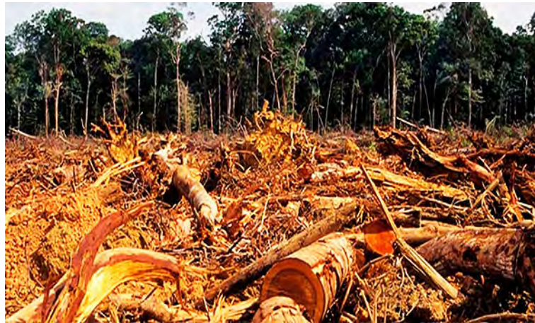
Figura 10: Proceso de deforestación de la Amazonia

Otro efecto de estas acciones sobre las selvas tropicales húmedas y que no siempre se tiene en cuenta, es que estas formaciones vegetales contienen gran parte (alrededor del 35 %) del C de la Tierra; la destrucción de la cubierta vegetal provoca la liberación de este elemento al ambiente y con ello se contribuye al calentamiento global. Casualmente, la conservación de áreas de pastizales y bosques mediante la implementación de sistemas de producción silvopastoril (Figura 11), es una estrategia muy efectiva para disminuir este efecto y el producido por la eliminación de gas metano ( \text{CH}_4 ) por parte de los herbívoros rumiantes (gas responsable en parte, del efecto invernáculo o invernadero global).