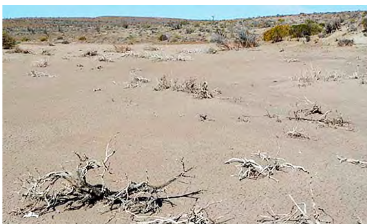
Figura 6: Proceso de desertificación

La desertificación se produce como consecuencia del inadecuado manejo y de la cosecha indiscriminada de recursos, lo que genera una pérdida masiva de la información del ecosistema en términos de especies animales, vegetales, compuestos químicos y estructura del suelo, lo que se traduce en disturbios progresivos que reducen cada vez más su productividad y estabilidad.