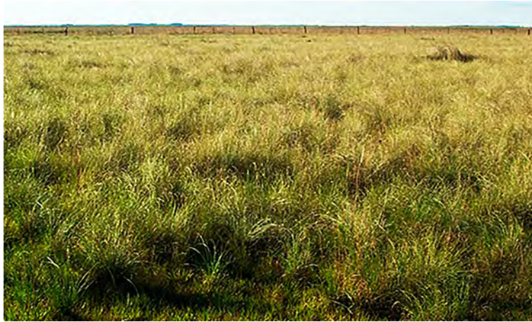
Figura 1: Pradera