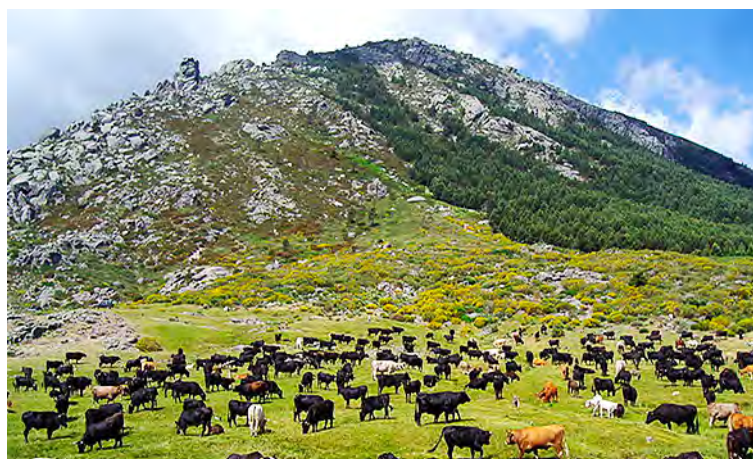
Figura 12: Ecosistema natural