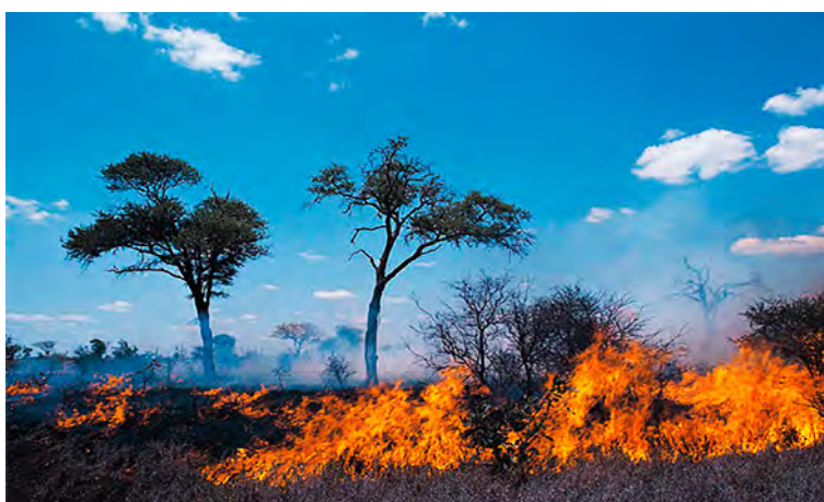
Figura 8: Fuego indiscriminado; una de las causas de desertificación

La Tabla 1 discrimina la superficie de los subtipos de pastizales naturales mundiales, dentro de los tres biotipos mencionados.