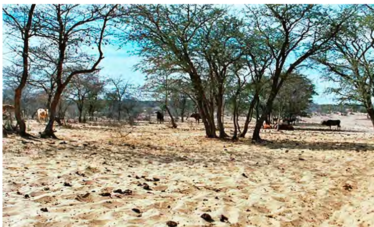
Figura 7: Sobrepastoreo; una de las causas de desertificación

Para lograrlo y poder hablar de conservación y manejo de los recursos naturales renovables, es importante conocer cuáles eran estos al principio de la civilización. Shantz (1955), estima la magnitud de la distribución de la vegetación terrestre y reconoce tres grandes biotipos: Bosques, con 5.670 millones de hectáreas; Pastizales, con 3.300 millones de hectáreas y Tierras Desérticas, con 4.430 millones de hectáreas.