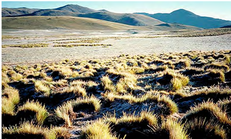
Figura 3: Estepa