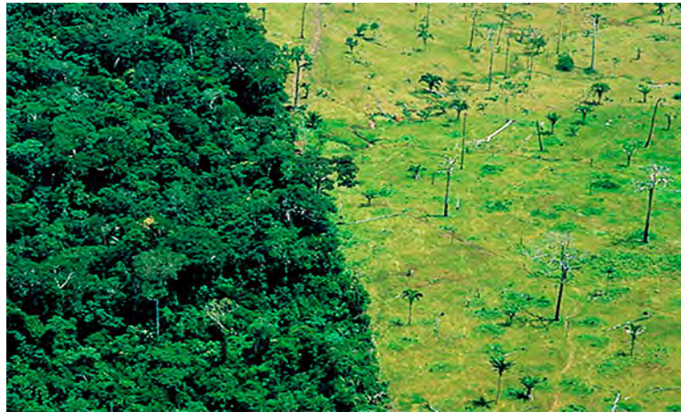
Figura 9: Proceso de deforestación de la Amazonia

mitiendo que sólo el 20 % de la Amazonia brasilera pueda ser deforestada para la agricultura o ganadería y cancelando las licencias de las compañías madereras que presenten irregularidades (Kishinami, 1996).