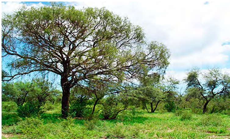
Figura 2: Monte