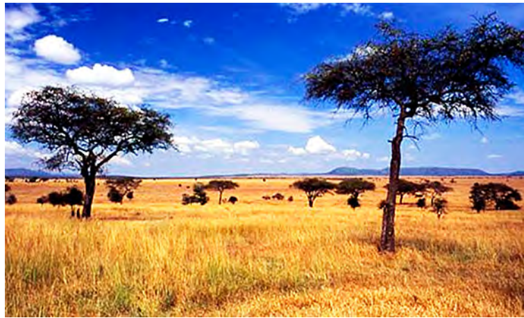
Figura 4: Savana

Es también el hombre, quien con el adecuado conocimiento de las leyes que rigen el comportamiento de los sistemas naturales y la aplicación de tecnologías sustentables, debe emprender el camino de la conservación y/o recuperación de estos ambientes, para asegurar la calidad de vida de las futuras generaciones.