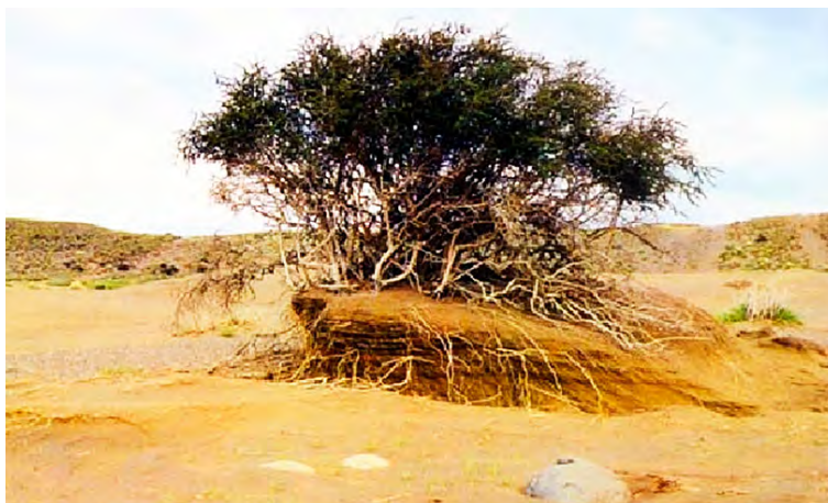
Figura 5: Proceso de desertificación

Margalef (1958), establece que los ecosistemas incoherentemente organizados o inestables, se modifican o destruyen fácilmente. La selección en favor de una organización coherente aporta información al sistema; aquellos sistemas que en la naturaleza son más diversos y con mayor información, son más estables.